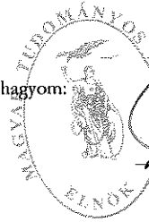
Freund Tamás az MTA elnöke

Az intézmény 2021. évi költségvetését jóváhagyom: